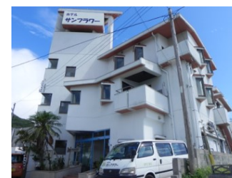
ホテル サンフラワー