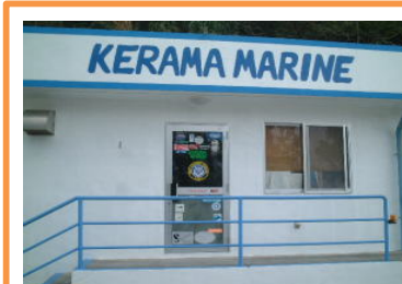
民宿けらまマリン