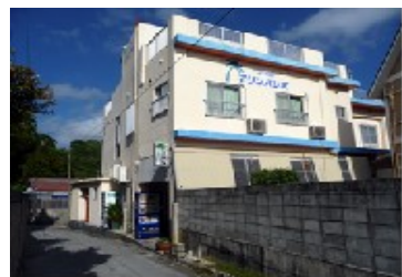
ペンション マリンパレス