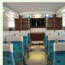
3.旅客室・イス席 (54名)