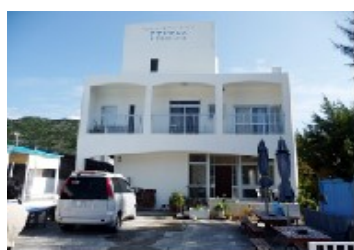
ペンション サザンクロス