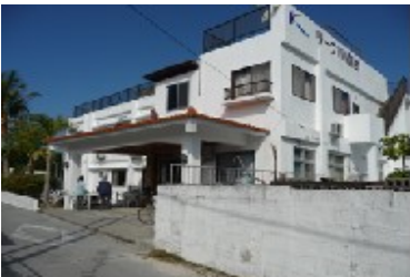
ペンション リーフINN国吉